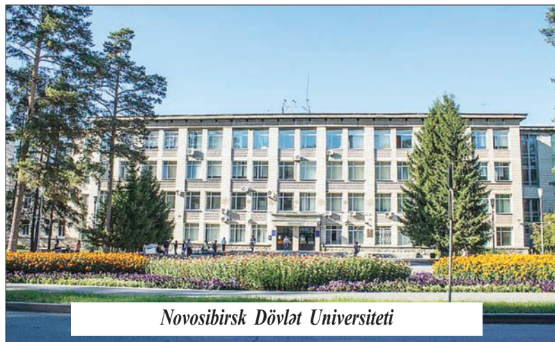
Novosibirsk Dövlət Universiteti