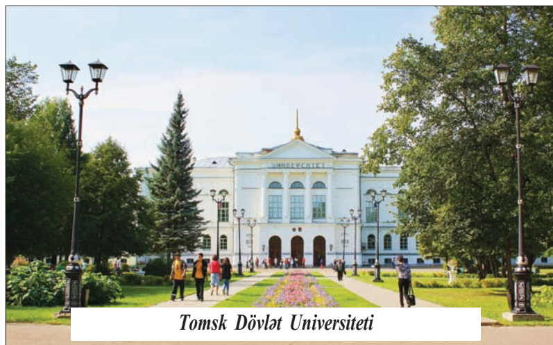
Tomsk Dövlət Universiteti